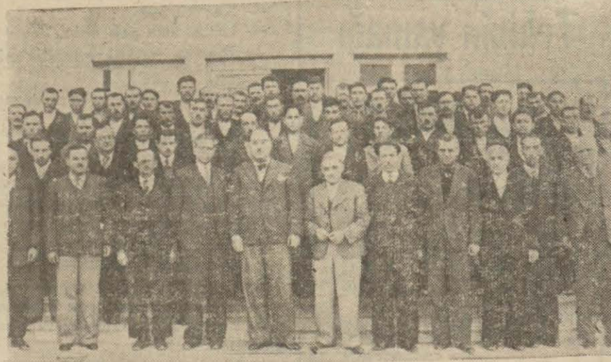
Köy kâtibleri vali ve mevalimleriyle bir arada

Köylüyü kalkındıracak unsurların başında bulunan köy kâtibleri için bir kurs açıldı ve ilk mezunlarını verdi